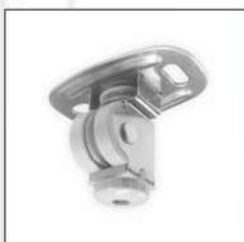
專利塑鋼導輪頂座