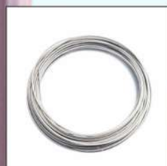
S304不鏽鋼高張力包膜鋼索